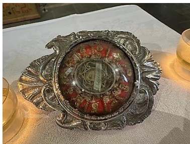
Beeld en relik van de H. Lucia In de Ewaldenkerk in Druten

Daarom wordt er dit jaar op de feestdag van H. Lucia, 13 december, in de H. Ewaldenkerk in Druten, een H. Mis uit dankbaarheid gevierd, met een lichtprocessie waarbij het beeld van de H. Lucia en haar relik worden rondgedragen.