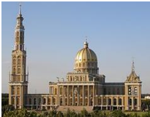
Mariabasiliek van Lichen

En op de laatste dag een bezoek aan Maria van Kevelaer en ter afsluiting een smakelijk afscheidsdiner!